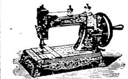
Macchine a mano d'ogni sistema