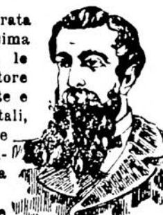
DOPO LA CURA

L'Acqua CHININA-MIGONE , preparata con sistema speciale e con materie di primissima qualità, possiede le migliori virtù terapeutiche, le quali soltanto sono un possente e tenace rigeneratore del sistema capillare. Essa è un liquido rinfrescante e limpido ed interamente composto di sostanze vegetali, non cambia il colore dei capelli e ne impedisce la caduta prematura. Essa ha dato risultati immediati e soddisfacentissimi anche quando la caduta giornaliera dei capelli era fortissima.