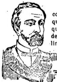
PRIMA DELLA CURA

CHININA-MIGONE e così evitare il pericolo della eventuale caduta di essi e di vederli imbianchirsi. Una sola applicazione rimuove la forfora e dà ai capelli un magnifico lustro.