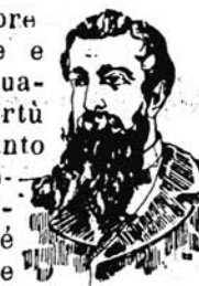
DOPO LA CURA

L'Acqua Chinina-Migone, preparata con sistema speciale e con materie di primissima qualità, possiede le migliori virtù terapeutiche, le quali soltanto sono un possente e tenace rigeneratore del sistema capillare. Essa è un liquido rinfrescante e limpido ed interamente composto di sostanze vegetali non cambia il colore dei capelli e ne impedisce la caduta prematura. Essa ha dato risultati immediati e soddisfacentissimi anche quando la caduta giornaliera dei capelli era fortissima. E voi, o madri di famiglia, usate dell'Acqua Chinina-Migone per i vostri figli durante l'adolescenza, fatene sempre continuare l'uso e loro assicurerete una abbondante capigliatura.