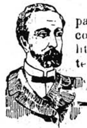
PRIMA DELLA CURA

Profumata, Inodora od al Petrolio Dichiarata da esimi Medici di vera azione terapeutica incontestabilmente utile alla Rigenerazione dei BULBI PILIFERI.