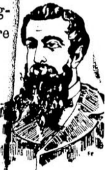
DOPO LA CURA

composta di materie di primissima qualità, assolutamente innocua, e resa maggiormente utile al bulbo capillare mercè l'unione della China col