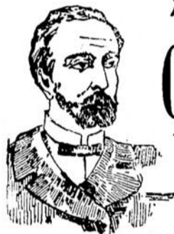
PRIMA DELLA CURA