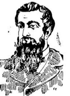
DOPO LA CURA

Si vende da tutti i profumieri, droghieri e farmacisti del Regno a L. 0,75 - 1,50 e 2 in fiale, ed a L. 3,50 - 5 - 8,50 in bottiglie grandi per uso di famiglia. Aggiungere centesimi 80 per spesa postale.