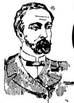
PRIMA DELLA CURA