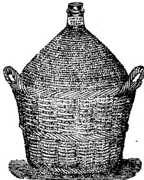
Capacità litri 10 a 60.

Premiate e Privilegiate DAMIGIANE BECCARO per Trasporto Vini Olii e Liquori tanto per terra che per mare senza pericolo di rotture e sottrazioni