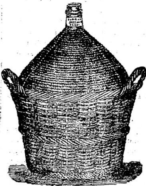
Capacità litri 10 a 60.

Adottate dal R. Governo per tutte le Scuole Enologiche del Regno